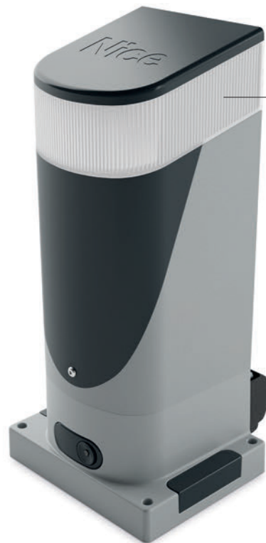
Luz con LED de cortesía o parpadeante

Para puertas correderas de hasta 400 Kg y longitud de la hoja de hasta 6 m